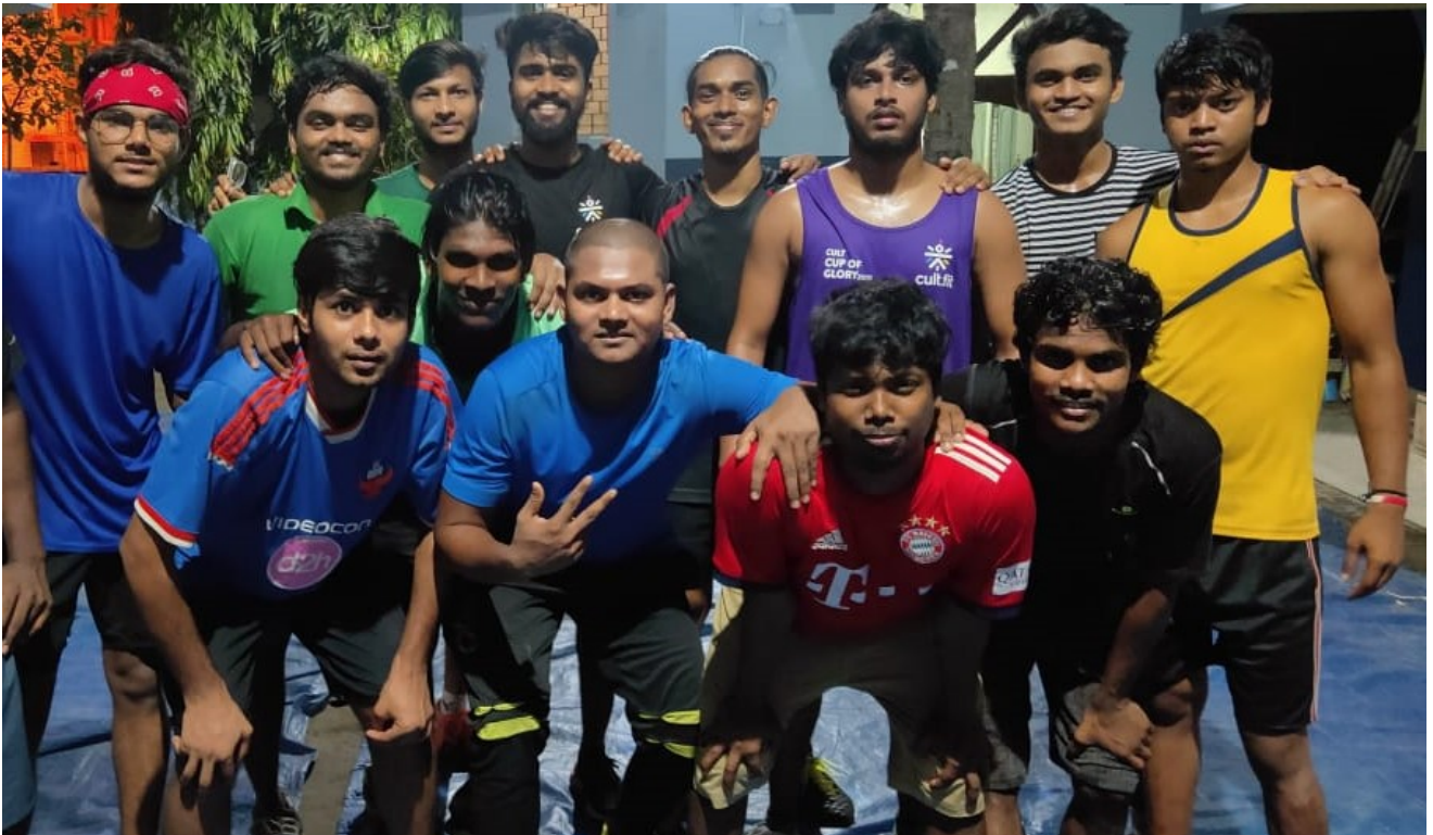
Freude über das Wiedersehen nach langer Zeit – der neue alte gemeinsame Haushalt