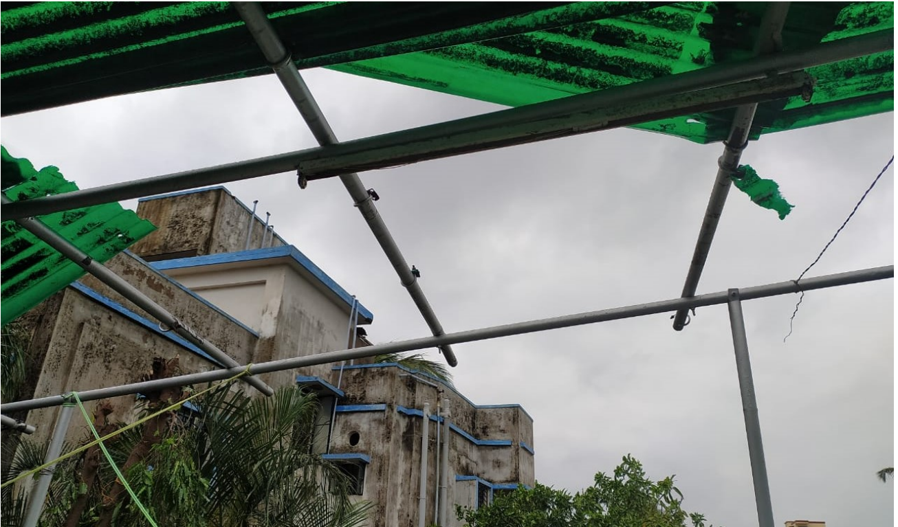
Sturmschäden nach dem Zyklon „Amphan“